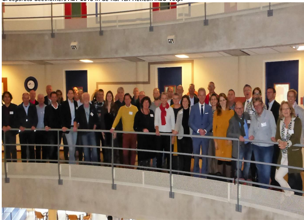
Groepsfoto deelnemers ALV 2018 in de hal van Helicon MBO Velp:

Rond 13.15 uur volgt een gezamenlijke lunch. Tijdens de lunch is er volop gelegenheid voor ontmoeting, kennismaking, kennisdeling en wederzien, tussen leden en gastsprekers.